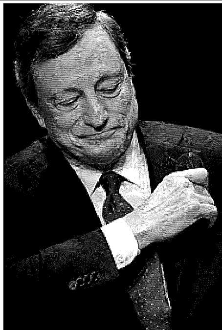
Presidente Mario Draghi, Banca centrale europea

«Abbiamo conseguito pace, prosperità e stabilità per un periodo senza precedenti»