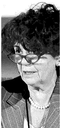
Il ministro Valeria Fedeli guida Istruzione, Ricerca e Università