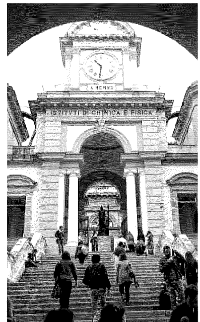
La ripartizione Il polo federiciano è in corsa per la gara di assegnazione delle risorse con soli tre dipartimenti dei tredici che partecipano al torneo nazionale