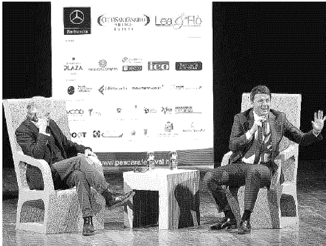
L'intervista Matteo Renzi sul palco di Pescara con Luca Sofri