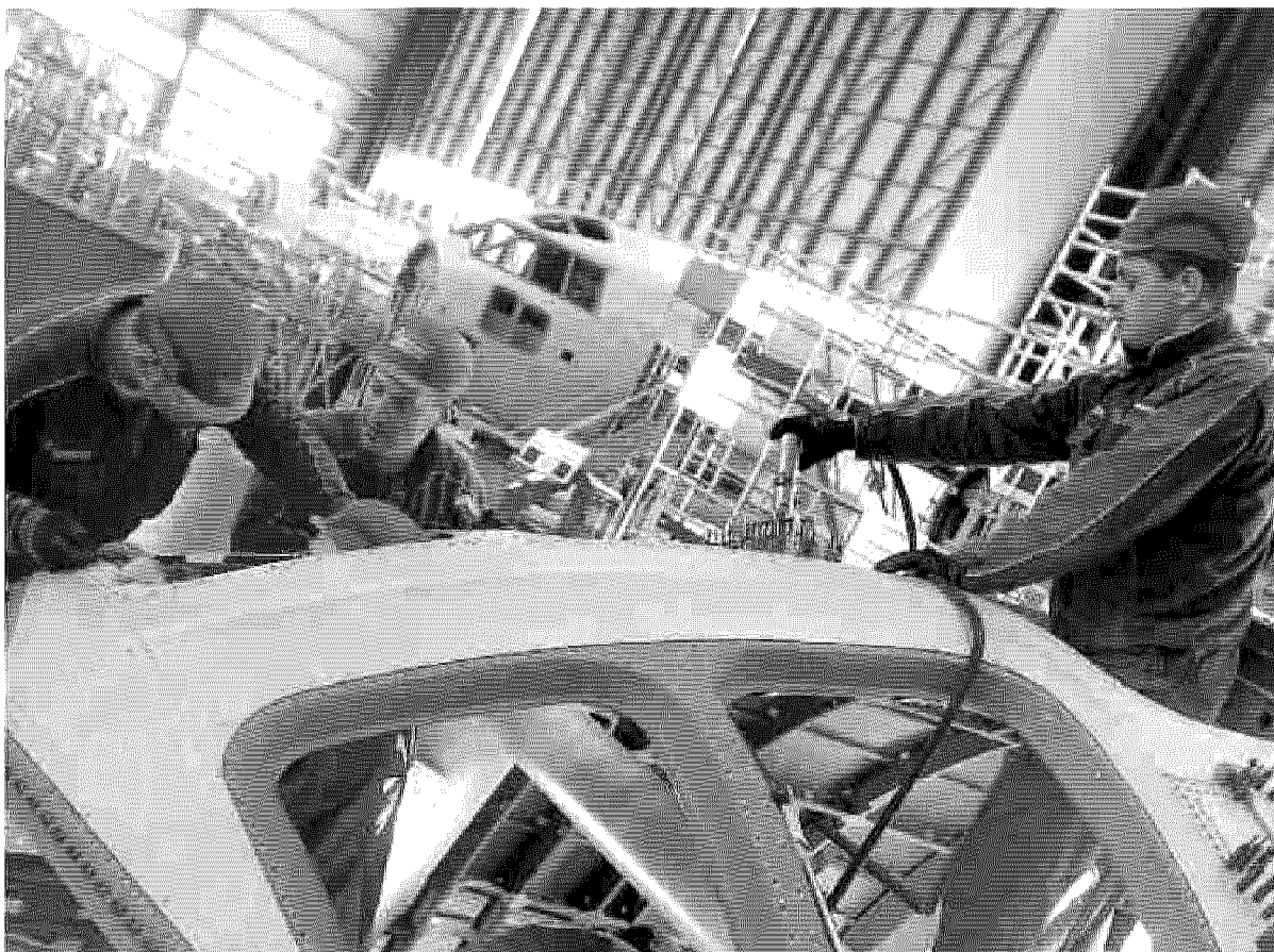
Operai al lavoro negli stabilimenti aeronavali dell'Alenia di Capodichino a Napoli

«Niente penalità per chi va prima di 62 anni. Rientra in questa categoria chi ha almeno 12 mesi di contributi versati»