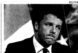
Matteo Renzi. Presidente del consiglio in carica

La nuova legge di bilancio deve arrivare in Parlamento entro il 20 ottobre, preceduta, entro il 27 settembre, dalla presentazione alle Camere della nota di aggiornamento al Def. Non cambiano, invece, i temi di approvazione della manovra, che va licenziata entro il 31 dicembre