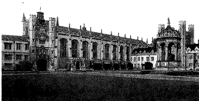
Meta di prestigio. L'università di Cambridge