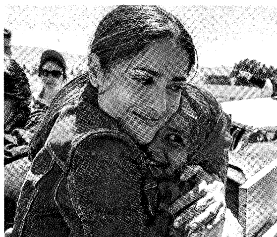
Salma Hayek incontra i piccoli rifugiati siriani in Libano