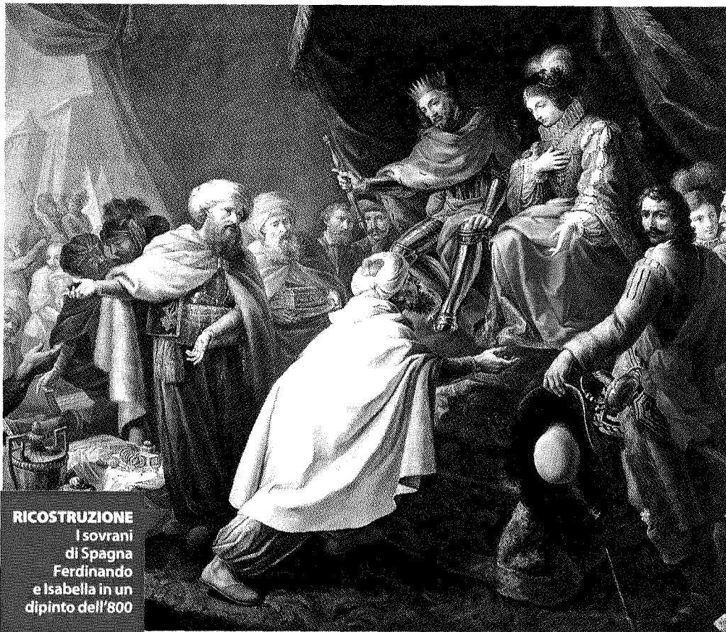
RICOSTRUZIONE I sovrani di Spagna Ferdinando e Isabella in un dipinto dell'800

Nel Novecento ha avuto grande influenza la scuola francese iniziata con la rivista Les Annales . Tra i nomi Marc Bloch , Fernand Braudel , Georges Duby e Jacques Le Goff (foto)