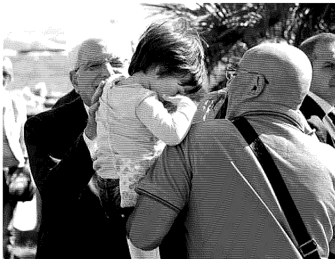
Sergio Mattarella gioca con una bimba sul lungomare