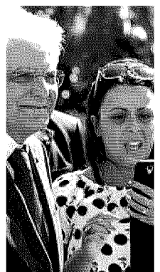
IL SELFIE Selfie con il Presidente