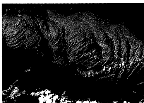
19 maggio Uno sguardo mozzafiato sui Caraibi