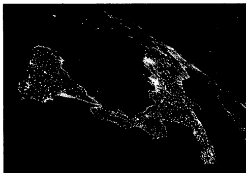
25 aprile La foto-omaggio all'Italia per la Liberazione